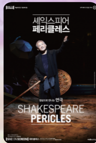
[연극] 페리클래스 6. 24. (수) 17시 30분