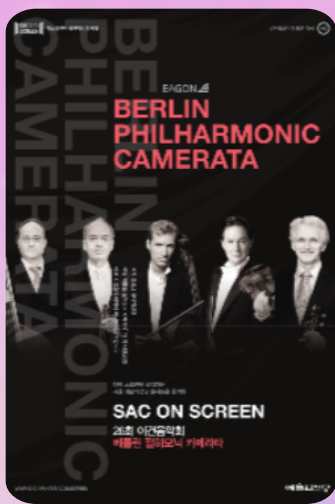
[음악회] 베를린 필하모닉 카메라타 4. 22. (수) 12시