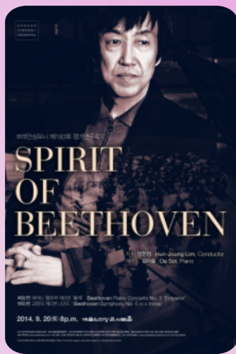
[음악회] 스피릿 오브 베토벤 4. 8. (수) 12시