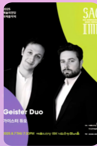
[음악회] 가이스터 듀오 5. 13. (수) 12시