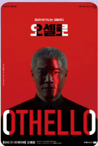
[연극] 오셀로 6. 10. (수) 17시 30분